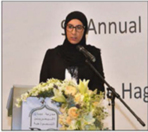
مفتحة النموذج الأمم المتحدة السيد راضية علي