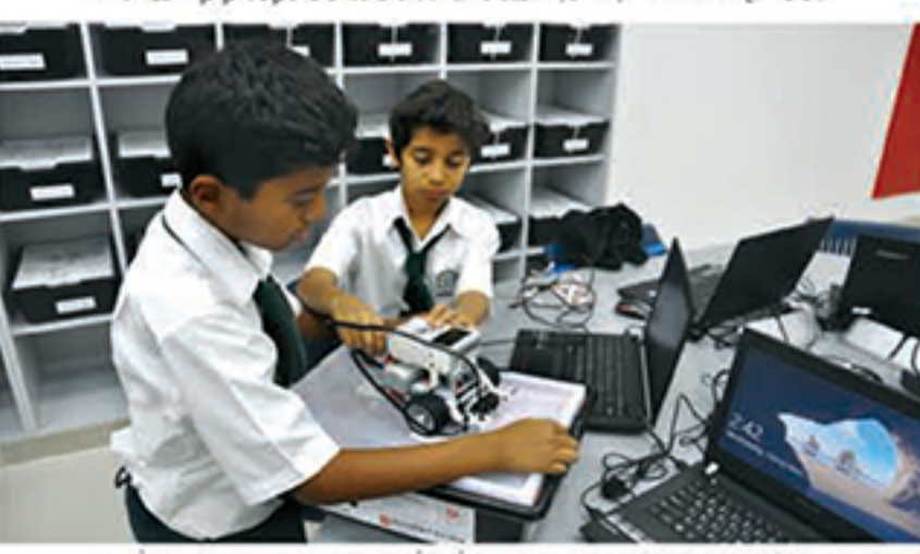
استحدثت المدرسة مبنى الحاسوب والتكنولوجيا الذي يعد من أكبر وأول مبنى للروبوتات على مستوى الشرق الأوسط.