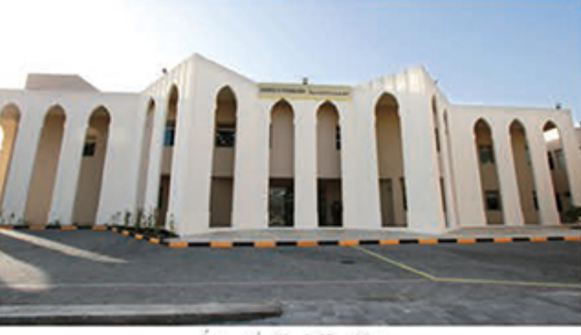
مبنى الحاسوب والتكنولوجيا الذي استحدث مؤخراً.

الدوليين الآن الانضمام إلى مؤتمر BayMUN. وعلى المستوى الرياضي، يحصد طلاب وطالبات المدرسة العديد من الجوائز المحلية والدولية بشكل سنوي. كما فاز ٣ من طلاب المدرسة، هم سالم النهدي وفاطمة جناحي وعمر شهاب بتمثيل البحرين كفريق روبوتات وطني في أولمبياد الروبوتات العالمي الذي يقام هذا العام في الهند. ومؤخراً، افتتحت المدرسة أكبر وأول مبنى للروبوتات على مستوى الشرق الأوسط. كما حازت المدرسة مؤخراً جائزة التعليم الدولية التي منحت من إمارة دبي في مجال الابتكار في تعليم اللغتين العربية والإنجليزية. وتتفخر المدرسة هذا العام قمة التعليم العالمية، التي انطلقت في عام ٢٠١١، حيث تقام تحت رعاية سعادة وزير التربية والتعليم، الدكتور ماجد بن علي النعيمي. واستطاعت القمة خلال السنوات الماضية أن تسجل كأكبر تجمع لقيادات التعليم في العالم. وقريباً، ستفتتح المدرسة مباني جديدة مشيدة على مستوى عالمي، حيث ستفتتح هذا العام مبنى الروبوتات الذي يعد الأول من نوعه على مستوى الشرق الأوسط، ومبنى آخر للروضة منفصل عن حرم المدرسة. وتعتبر المدرسة نموذجاً للمدارس العالمية، حيث توفر طبية وممرضة وأخصائية تغذية ضمن برنامج خاص، وذلك إلى جانب برنامج وحدة مراقبة جودة التعليم والتنفيذ في المدارس ووحدة مراقبة سلوك الطالب.